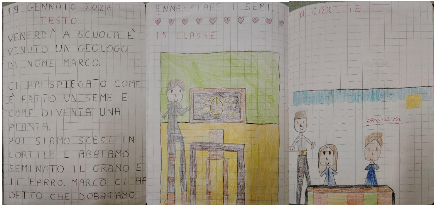
Scuola Primaria - Classi prime Cepagatti c.u.