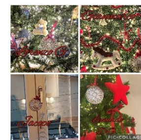
Scuola dell'infanzia di Villareia