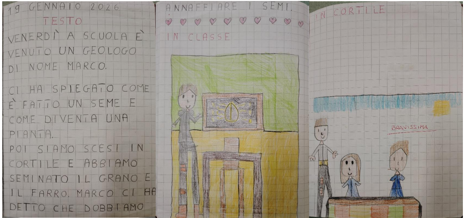
Scuola Primaria - Classi prime Cepagatti c.u.